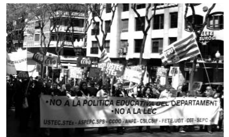
La manifestació va recórrer la rambla Nova

Els sindicats demanen el manteniment de l'oferta pactada o l'ampliació dels pactes d'estabilitat, i rebutgen la desregulació horària, l'augment de la jornada lectiva, la disminució de l'oferta pública d'ocupació, la retallada de les plantilles, la