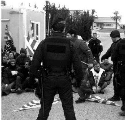
El piquet informatiu va ser desallotjat

Al dia següent, mentre els treballadors mantenien el piquet muntat davant de la porta de l'empresa, van fer acte de