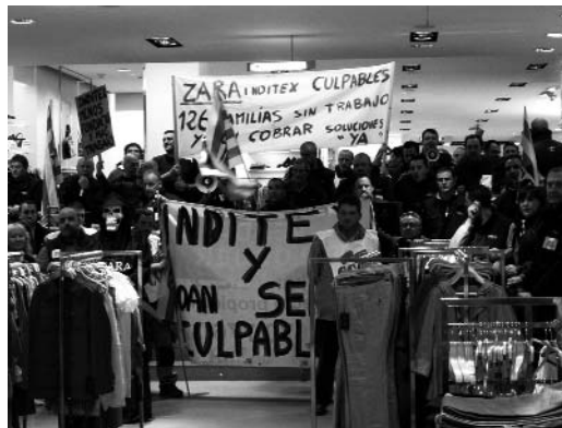
Els treballadors d'EMS es van tancar a la botiga que Zara té al carrer Colom de Tarragona

Així, en les darreres setmanes els treballadors s'han concentrat a les portes del Zara ubicat al Portal de l'Àngel de Barcelona i al que està situat al carrer Colom de Tarragona, a on, a més, s'hi van tancar fins que no van rebre una resposta del grup Inditex. Resultat d'aquesta concentració, van ser dues reunions amb el grup, el qual va reiterar que aquesta situació no l'han provocat ells i que no es faran càrrec de la situació.