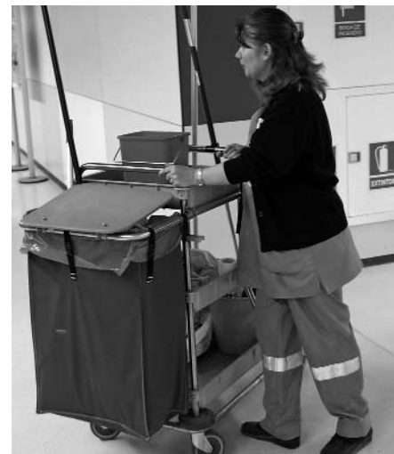
Cap treballadora d'Eulen serà acomiadada

De tota manera, després de diversos estira i arronsa amb l'empresa, el comitè ha arribat a un pacte amb Eulen. Així, no s'acomiadarà cap treballadora ni seran desplaçades a un lloc de treball que estigui a més de 25 quilòmetres del terme municipal de Reus. Aquelles que siguin obligades a desplaçar-se a un altre lloc de treball, rebran una paga i mitja extra anual.