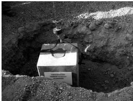
Col·locació de la primera pedra de la promoció

A la província de Tarragona, la cooperativa ha lliurat ja 181 habitatges amb protecció oficial (36 a Tarragona, 14 al Vendrell, 48 a Reus, 27 a Constantí i 56 a Montblanc). Actualment té en construcció 121 pisos més (73 a Constantí i els 48 que ara s'inicien) i, en projecte, 463 habitatges amb protecció oficial, 26 a Banyeres del Penedès, 251 a Constantí, 26 a l'Hospitalet de l'Infant i 160 a Tarragona. A més, ha entregat també 12 habitatges lliures al Vendrell.