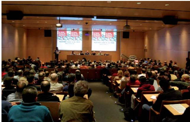
El passat 24 de novembre vam celebrar una assemblea a Sabadell

No ens conformem dient, que ho diem i és veritat, que aquestes pretensions són, a més de perjudicials per a les persones assalariades, el contrari del que necessita l'economia, que és pretendre curar-nos la malaltia amb les mateixes receptes que ens la van provocar. A més de dir que hem de deixar de banda, d'una vegada i per sempre, qualsevol temptació de perpetuar un