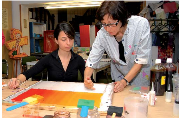
La salut dels treballadors i treballadores ha de ser un tema prioritari per als empresaris

Les implicacions que té avui dia el reconeixement d'una malaltia laboral –ja sigui en la declaració d'una incapacitat temporal (IT), per la diferència en la base de càlcul de la prestació consegüent, o pel que pot comportar de revisió de tots els elements i condicions que conformen el lloc de treball, i per tant en la millora de les condicions de treball d'un o de milers de treballadores i treballadors– fan per si sols que aquest objectiu pagui la pena. En aquest treball ens tocarà saber i fer saber, és a dir, conscienciar-nos i conscienciar del que són i impliquen les malalties professionals i dels drets que tenim i que ens assisteixen. La percepció del salari és, sens dubte, part de la contraprestació al nostre esforç i dedicació, però no podem consentir que sigui l'únic; els treballadors mereixem rebre benestar personal, hem de gaudir dels assoliments aconseguits amb el nostre esforç, i això passa, indiscutiblement, per tenir garantides en el nostre lloc de treball unes òptimes condicions laborals. La salut del treballador no pot convertir-se en el peatge per pagar a l'autopista del mercat laboral, i així ha d'assumir-ho l'empresari i reflectir-ho en la seva agenda com a prioritari. En aquest punt, la formació dels nostres delegats de prevenció, però també la pressió que com a sindicat exercim