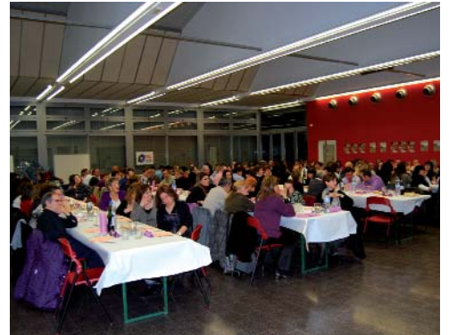
Sopar solidari amb el poble palestí i les dones àrabs d'Israel