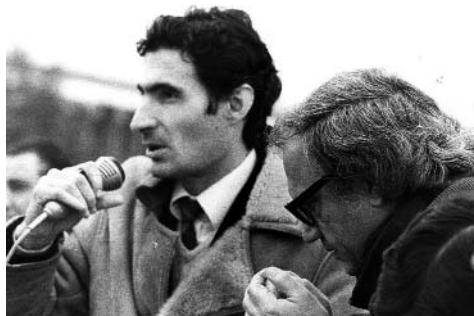
Toni Farrés parla en un acte de la campanya d'eleccions autonòmiques del 1980

El Sabadell d'avui és la ciutat que van imaginar, dissenyar i construir en Toni i els seus respectius equips, la ciutadania i les seves entitats i associacions. La seva capacitat, tenacitat, honestetat, generositat, proximitat amb les persones i el coneixement de les necessitats, i sobretot la seva ètica en relació amb la gestió pública, fan d'en Toni Farrés una de les persones més importants de Sabadell de tot el segle xx.