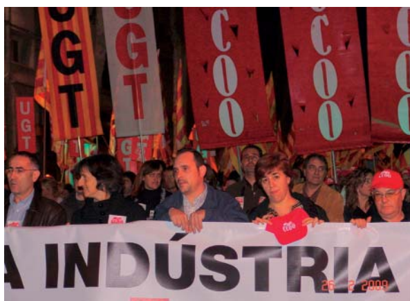
Manifestació unitària a Sabadell el 26 de febrer passat

Alguns ja han passat de la sorpresa inicial i tornen a donar les receptes de sempre, que són més del mateix del que ens ha portat a la situació actual. Tornem a sentir que cal abaixar els impostos (els seus), mentre és més necessari comptar amb recursos per impulsar l'economia des del sector públic i per atendre les creixents necessitats dels afectats per la crisi. Tornen a parlar d'abaratir l'acomiadament i no trigaran gaire a demanar retallar l'"excessiva" despesa en prestacions de l'atur o a reprendre l'ofensiva contra el sistema públic de pensions. Alhora, són incapaços de donar un sol argument que expliqui la crisi com a conseqüència de la legislació laboral, no tenen cap solució per a les persones aturades més enllà de parlar de la "cultura de l'esforç" o intenten amagar que els fons privats de pensions han