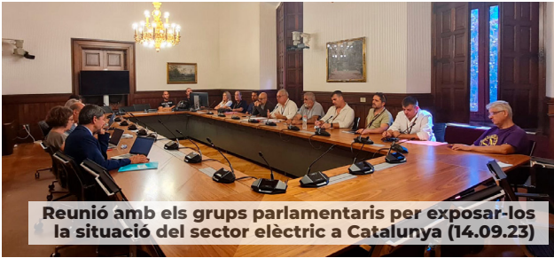
Reunió amb els grups parlamentaris per exposar-los la situació del sector elèctric a Catalunya (14.09.23)

La decisió unilateral d'Endesa de paralitzar la majoria de les inversions en la xarxa elèctrica, més enllà de les estrictament obligatòries o de les generades per la resolució d'avaries, ha provocat una situació d'alerta al sector elèctric per la seva afectació en l'ocupació i per les implicacions que això suposa per a la millora de la xarxa elèctrica i la qualitat del servei.