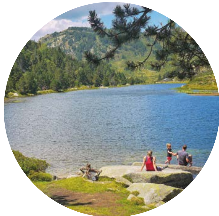
LLAC DE LA PRADELLA Alt. 1 991 m

A Font-Romeu Pyrénées 2000, podreu escollir senders per córrer o per caminar en mode contemplatiu! Partiu a la conquesta dels nostres senders per a tots els nivells i preneu els nostres remuntadors per a accedir a unes vistes extraordinàries.