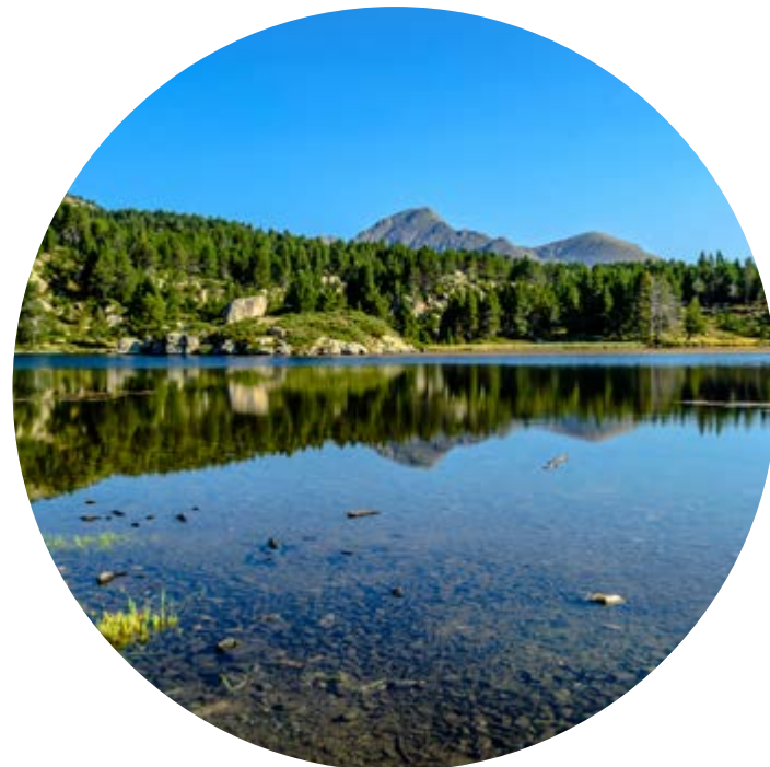
LLAC DE LA BOLLOSA Alt. 2 017 m

Envoltat de pins i ginestes, admireu de lluny els Pics Pèrics i aprofiteu el nombrós rocam per fer un pícnic.