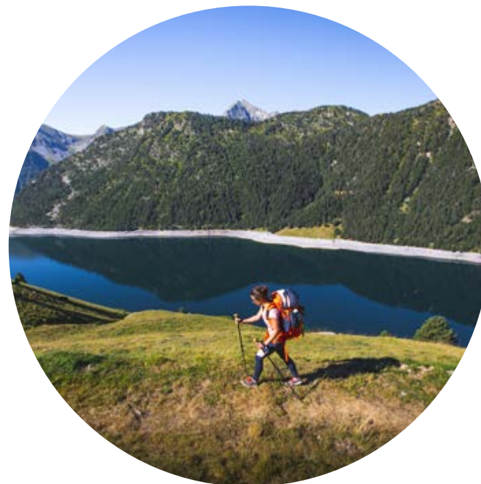
ENCARA MES AMUNT?

Gràcies al telecadira Bouleaux , accediu en pocs minuts a 2.213 m i admireu el panorama! Tot a dalt, trobareu la taula d'orientació que us ajudarà a (re) conèixer els cims, a continuació, preneu el vostre temps per compartir l'aperitiu abans de baixar agafant els nostres dos magnífics senders senyalitzats.