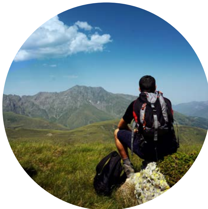
DESIG DE GUANYAR EN ALTURA?

Apreciaràs especialment la tranquil·litat d'aquest lloc únic!