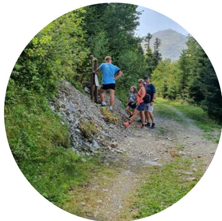
CAMINADA AL PLA D'ADET

Si esteu a la recerca de paisatges fantàstics, (re) descobriu Saint-Lary: situat al cor de grans espais protegits, us encantarà! Aquí, l'excursió es viu en GRAN sigui el que sigui el teu nivell.