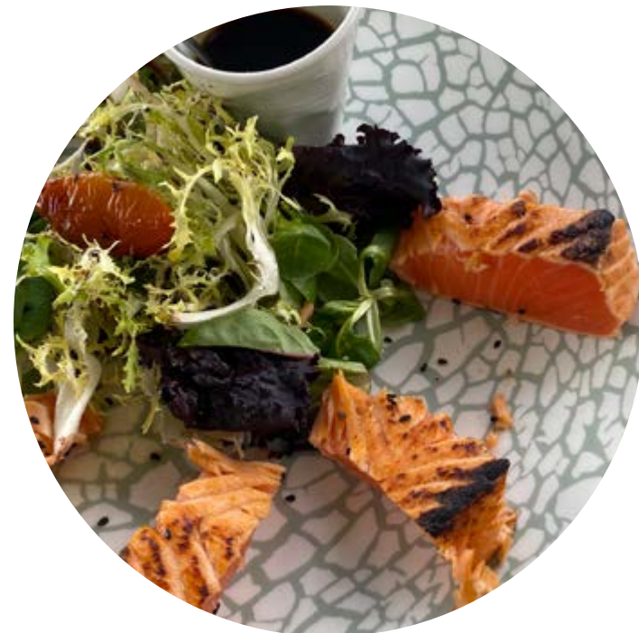
LA RUTA DEL PALADAR

El llac i els seus voltants constitueixen un espai natural reconegut des de 1976. És el terreny de joc perfecte per a fer excursions familiars.