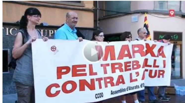
vídeo de la marxa