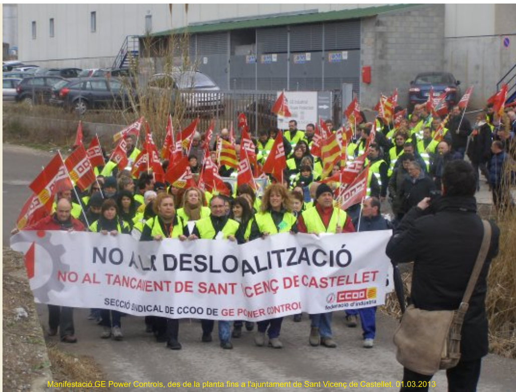
Manifestació GE Power Controls, des de la planta fins a l'ajuntament de Sant Vicenç de Castellet. 01.03.2013

La direcció de General Electric Power Controls va anunciar el passat 14 de febrer al comitè d'empresa la seva decisió de tancar la planta de Sant Vicenç de Castellet, on actualment treballen 135 persones. La Federació d'Indústria de CCOO de Catalunya rebutja totalment el tancament de la factoria i denuncia que es tracta d'una deslocalització pura i dura, ja que no hi ha causes objectives que justifiquin la decisió i, a més a més, l'empresa té beneficis.