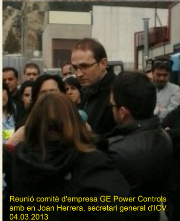
Reunió comitè d'empresa GE Power Controls amb en Joan Herrera, secretari general d'ICV. 04.03.2013

Davant d'aquesta situació, la Federació d'Indústria de CCOO de Catalunya exigeix a l'empresa que faci marxa enrere en les seves intencions i insta l'Administració catalana a intercedir davant la multinacional per defensar els llocs de treball i la continuïtat de l'activitat industrial de la planta de Sant Vicenç de Castellet.