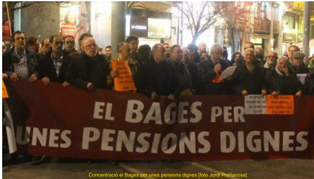
Concentració el Bages per unes pensions dignes

Unes 200 persones es van concentrar dijous, 31 de gener, a la plaça Sant Domènec de Manresa, sota el lema "el Bages per unes pensions dignes". L'acte va ser convocat per la Coordinadora de Pensionistes i Jubilats de Manresa per reclamar unes pensions dignes, i comptava amb el suport de les federacions d'associacions de veïns de Manresa i el Bages, de CCOO i UGT i de CiU, PSC, ERC, CUP, ICV i EUiA va consistir en la lectura d'un manifest que posava sobre la taula la baixada de poder adquisitiu dels pensionistes després del decret llei aprovat pel govern espanyol en la que no es consolida l'1'9% de desviació de l'IPC agreujat pel "fet diferencial català" que fa la situació més greu a Catalunya amb un IPC més elevat que a l'estat.