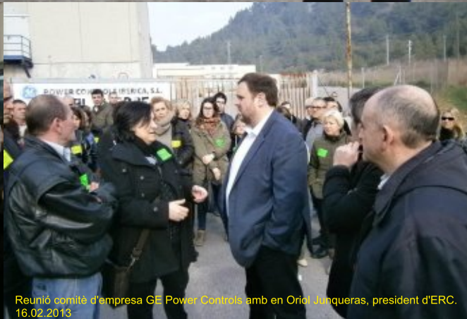
Reunió comitè d'empresa GE Power Controls amb en Oriol Junqueras, president d'ERC. 16.02.2013

Norden ha ampliat fins a 22 persones els treballadors que continuen a la fàbrica de Cabrianes.