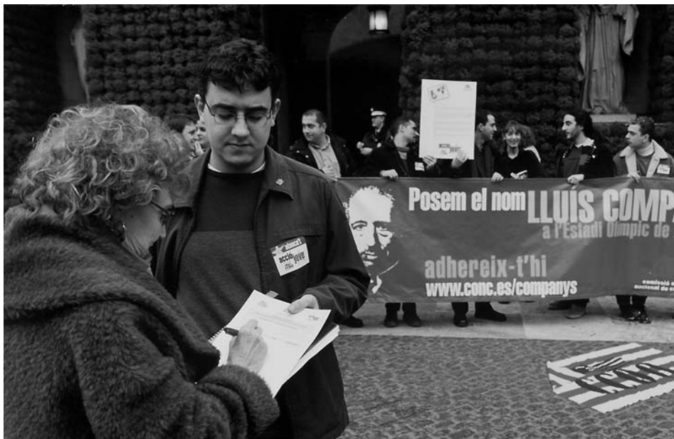
Campanya pública d'adhesió: Estadi Olímpic Lluís Companys (2000)