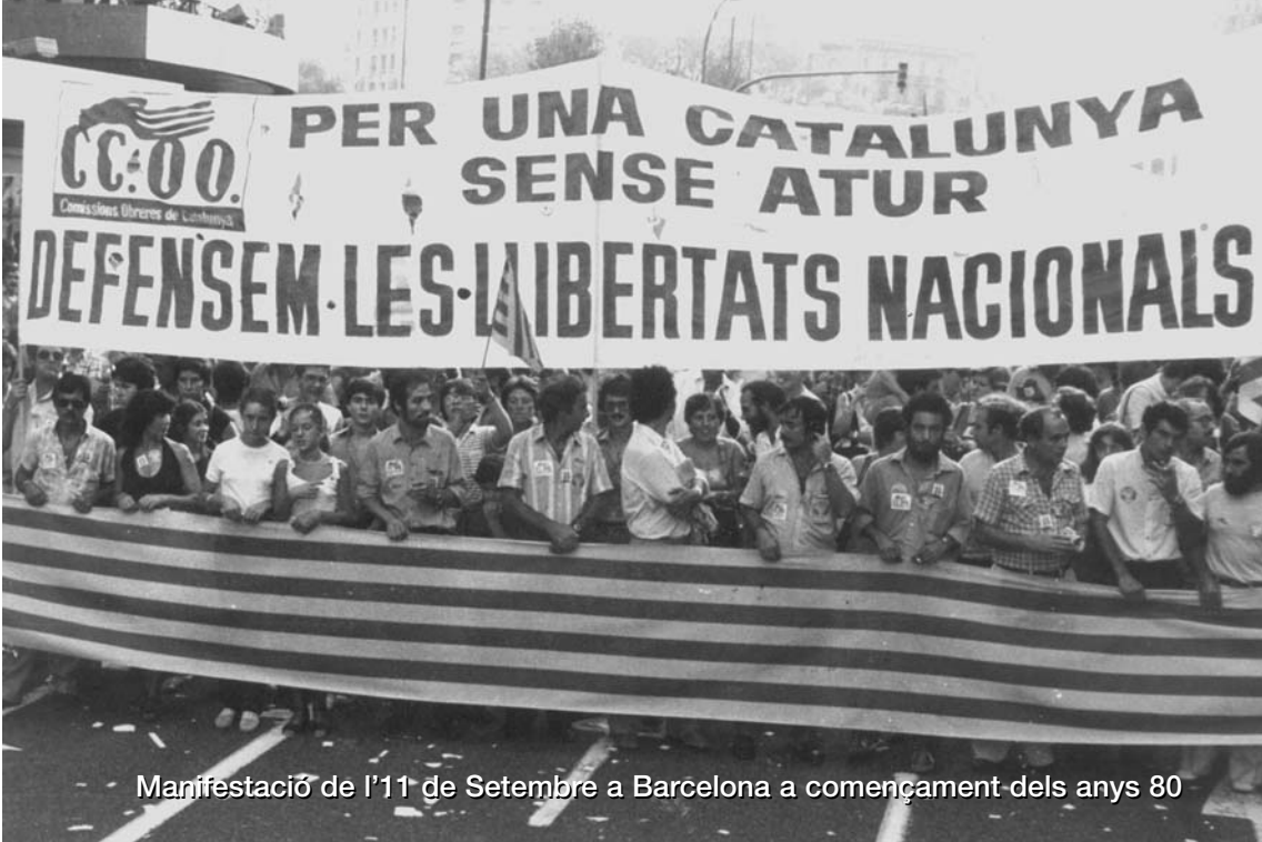
Manifestació de l'11 de Setembre a Barcelona a començament dels anys 80