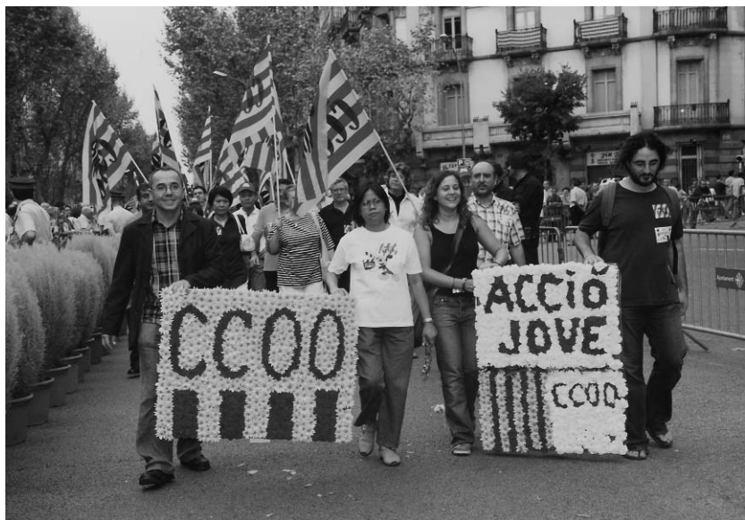
Ofrena floral al monument de Rafael de Casanova (2004)