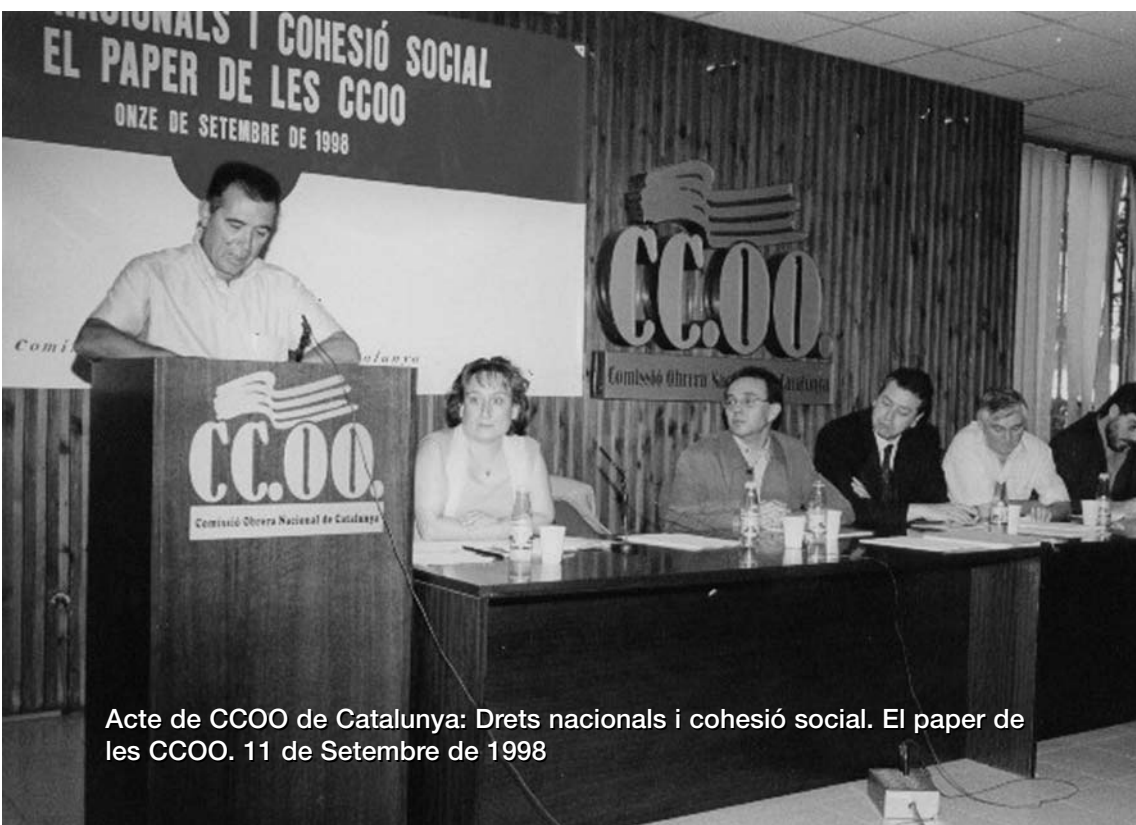
Acte de CCOO de Catalunya: Drets nacionals i cohesió social. El paper de les CCOO. 11 de Setembre de 1998