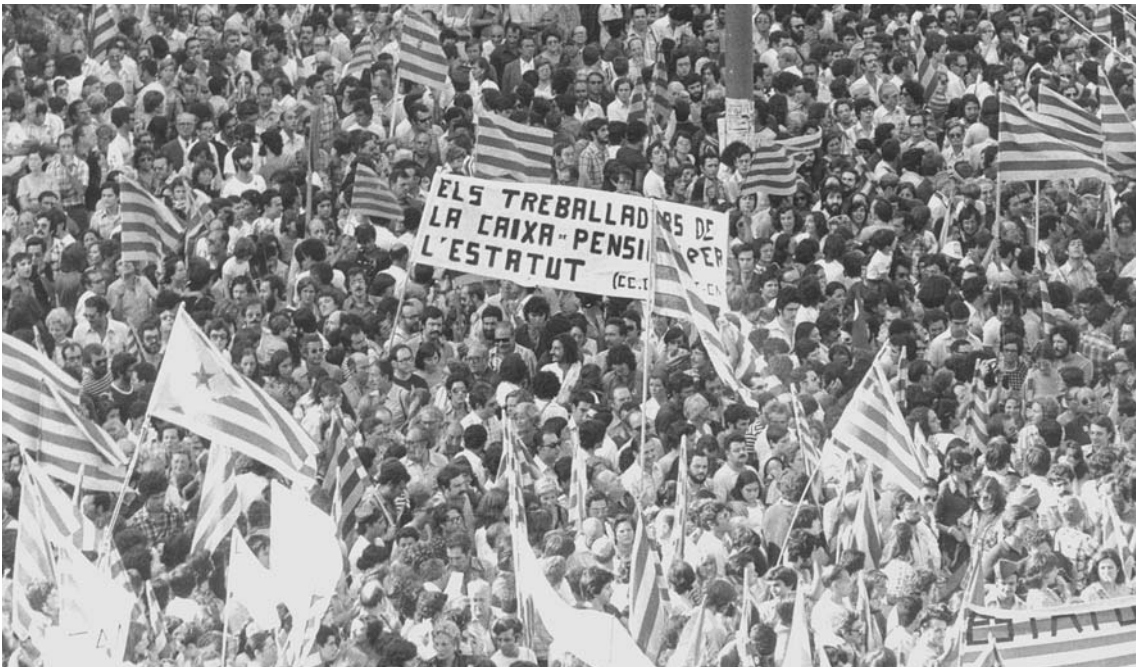
Manifestació de l'11 de Setembre de 1977