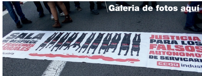
Galeria de fotos aquí

Aquesta mobilització és part de la campanya de denúncia pública que estem duent a terme per regularitzar els falsos