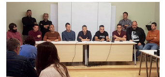
Roda de premsa del Comitè d'empresa de Nissan

El passat 26 de març, la direcció de Nissan al més alts nivell va anunciar les mesures que cal afrontar segon ells per afrontar la situació de baixes produccions actuals i dels propers anys.