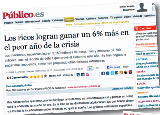
Els milionaris espanyols guanyen 2.150 milions d'euros més durant l'any 2011.

Aquí teniu alguns exemples de la indecència dels nostres governants quan ens diuen que no hi ha diners per mantenir els nostres serveis públics. I no ho diem nosaltres, són notícies recollides de diferents mitjans de comunicació. Aleshores, per a qui no hi ha diners?