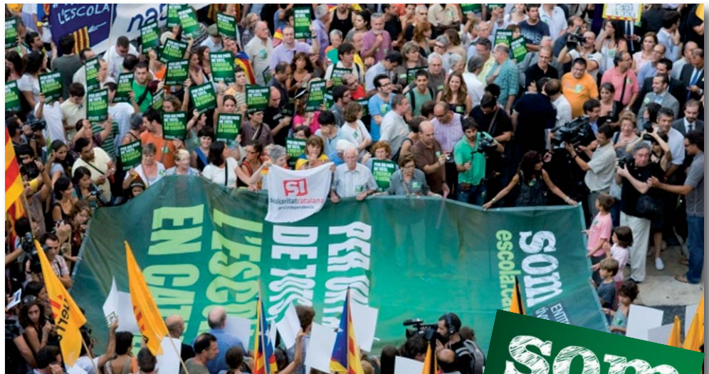
Milers de persones van participar a la concentració de la pl. Sant Jaume, de Barcelona

El model de l'escola catalana és un patrimoni que no podem deixar perdre