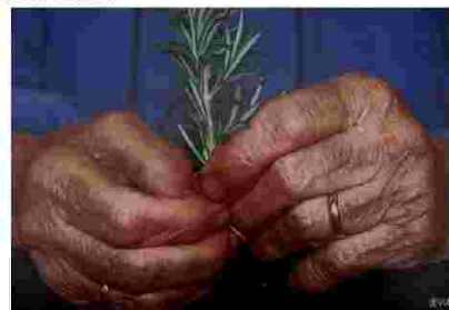
Fotografies positivades en Impressions Granollers - Fotobook

Homenatge a les dones grans que han deixat empremta en el món laboral amb el seu treball i esforç i que de ben segur les seves mans en són un bon reflex.