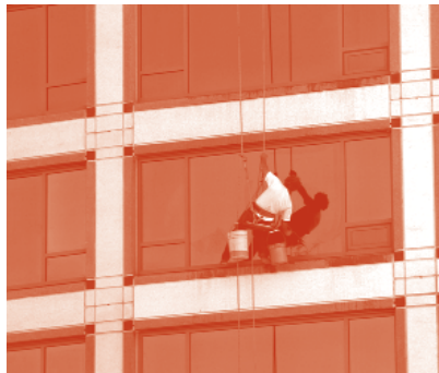
S'ha de seguir lluitant per millorar les condicions de treball

La manera com treballem no és bona per a la salut, ja fa més de deu anys que fins i tot la llei diu que això s'ha de canviar, però normalment sense la pressió sindical les coses no avancen. Vegem-ne un cas: l'empresa troba que és més fàcil canviar personal "espatllat" per personal nou de trinca que no pas millorar les condicions de treball, perquè molt sovint aquest personal "espatllat" no figura oficialment com a víctima d'una feina en males condicions. Ara bé, si ens ho proposem, aquestes persones figuraran com a víctimes oficials. Els seus subsidis seran més alts i, sobretot, els sindicalistes tindrem més força per millorar les condicions de treball. Per ajudar els comitès d'empresa o els delegats i delegades a fer aquesta tasca, la Unió Comarcal d'Osona de CCOO ha organitzat un servei d'assessorament directe, disponible a la seu de la Unió, de 10.00 a 14.00 i de 16.00 a 18.00 h. Abans de venir a informar-vos-en, truqueu al telèfon 93 886 10 23 i demaneu una cita.