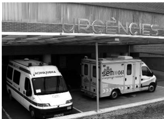
Els serveis d'urgències a la comarca han sofert una retallada

Malauradament, a Osona, aquest procés de reforma s'està portant a terme de la manera més dolorosa, amb la dura imposició d'un model que consisteix en una gran retallada de serveis. Aquesta retallada s'ha decidit atenent més a criteris polítics i econòmics que no pas a les necessitats sanitàries d'una comarca amb unes característiques físiques i demogràfiques que no han estat ben calibrades.