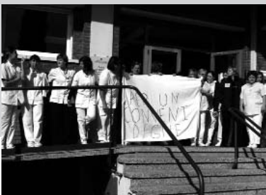
Concentració davant la residència Sant Gabriel de Centelles

va optar per fer concentracions en els centres de treball i davant de la patronal ACRA a Barcelona.