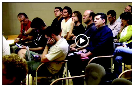
Imatge de l'emissió d'El Prat TV del Ple municipal de l'Ajuntament del Prat de Llobregat (13.09.18)

El Ple municipal de l'Ajuntament del Prat de Llobregat ha aprovat per unanimitat una moció de suport als treballadors acomiadats per Alliance Healthcare presentada per CCOO i ha manifestat el seu suport als afectats i al sindicat en aquesta lluita.