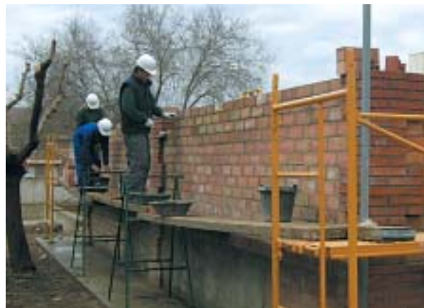
Alumnes del cicle formatiu de grau mitjà de la construcció fent pràctiques a l'Institut de Sant Vicenç

El sector de la construcció, que té una importància rellevant a les nostres comarques, és un dels que necessita profes-