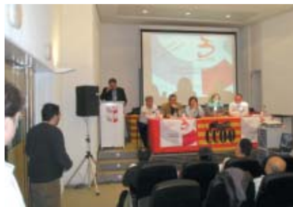
Un momento del acto del pasado 11 de marzo en Manresa

En este sentido, que los documentos congresuales sean cada vez más accesibles y que se remitan a toda la afiliación demuestra que FITEQA pretende hacer partícipes de los periodos congresuales, de los periodos de reflexión, al mayor número de personas de nuestra organización. En la misma línea que la Federación, FITEQA Bages-Berguedà ha pretendido confeccionar un documento de