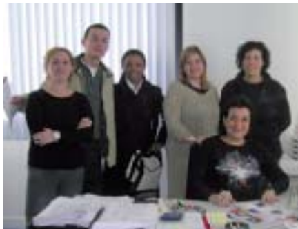
Mayor presencia de la mujer en la Comisión Ejecutiva

En consecuencia, estamos en un proceso en el que deberemos hacer un balance del trabajo realizado, de nuestros avances y de nuestras carencias y dificultades así como proyectar de cara al futuro nuestras propuestas sindicales, propiciando la más amplia participación de nuestros afiliados y