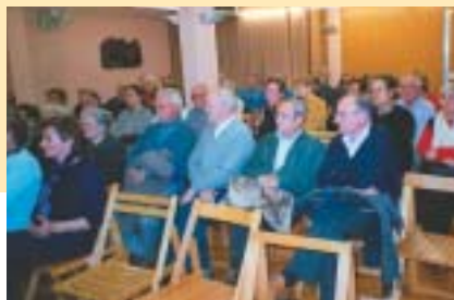
Assistents a la conferència

En acabar l'acte es va fer un pisco-bis per a tots els assistents.