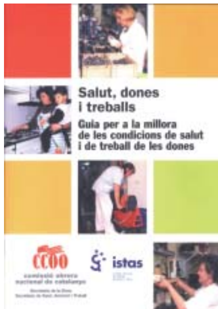
Portada de la guia editada per les secretaries de la Dona i de Salut, Ambient i Treball

destaquen: el que les dones per un mateix treball cobren menys que els homes, el menor accés a la formació i a la promoció, i menys participació en la presa de decisions.