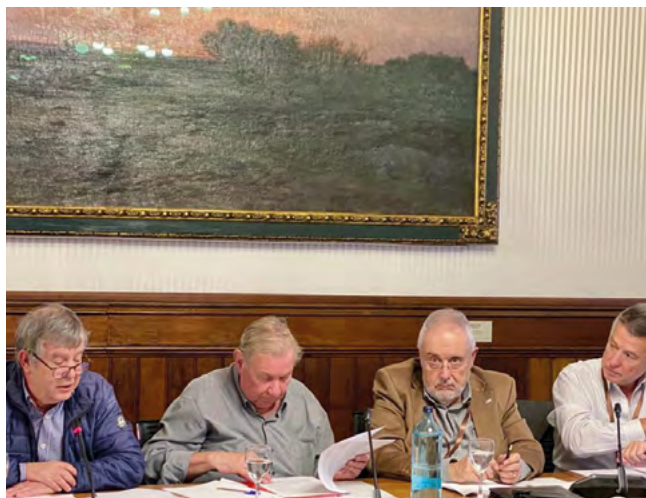
Compareixença en la proposta de Llei de la gent gran.