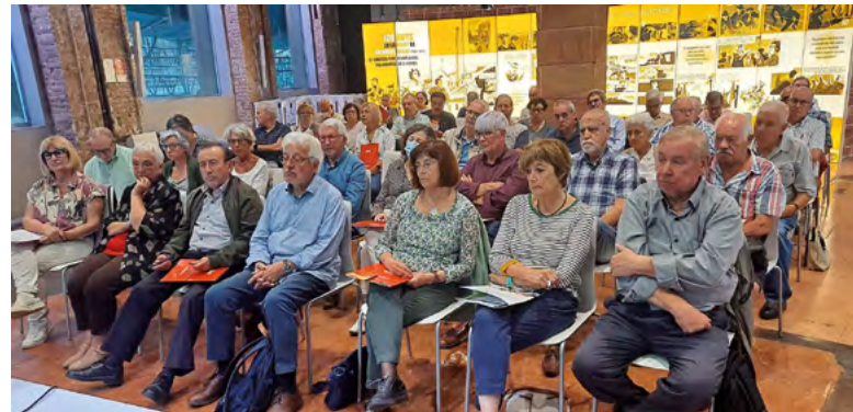
Assistents a les jornades d'Acció Sindical.