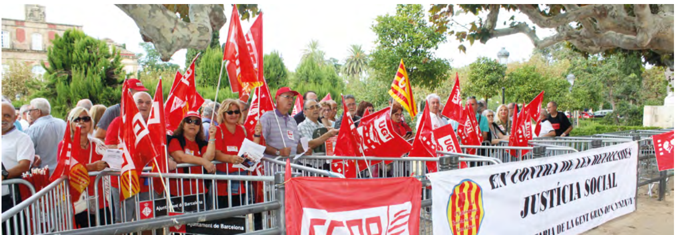
Pensionistes i jubilats davant el Parlament

Secretari d'Organització de la Federació de PPJJ de Catalunya