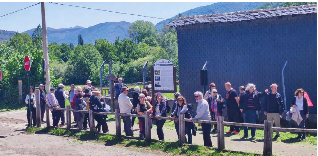
Robles de Laciana

Hem visitat, a Barcelona, el Barcelona Supercomputing Center, al barri de Pedralbes, situat en una de les pro-