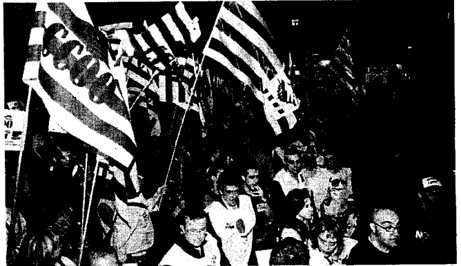
La manifestació va baixar de Via Laietana a la plaça de Sant Jaume de Barcelona.

La patronal Cecot va assegurar, però, que cap de les seves empreses associades s'hi havia afegit.