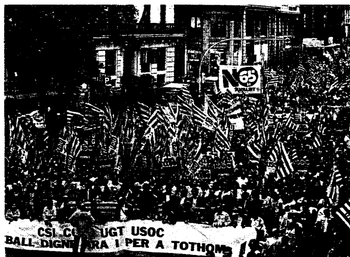
Barcelona se echó a la calle para reivindicar un trabajo decente.

Una vez dentro de los vagones, la megafonía solo informa de unas obras que inhabilitan el pasadizo subterráneo de una estación. Son las 12.00 y el metro se para en la estación Sagrada Familia. Andrea, de 33 años, dice