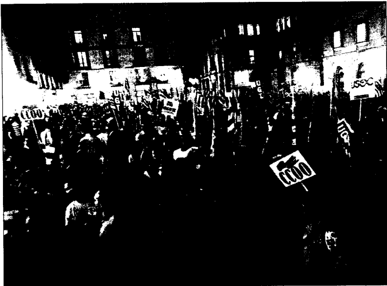
Aspecto que ofrecía ayer la manifestación por el trabajo digno en Barcelona.