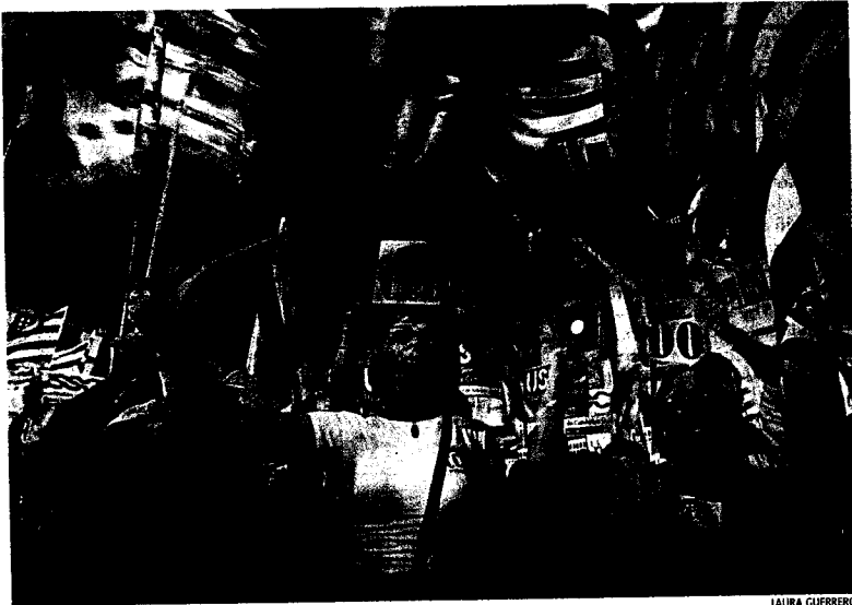
Un grupo de trabajadores en la manifestación de ayer en Barcelona