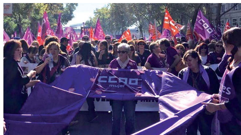
Un moment de la manifestació a Madrid el 7N contra les violències masclistes

I de 10.30 h a 14 h Acte a la sala d'actes de CCOO, a la planta baixa de Via Laietana, 16, de Barcelona: Posada en comú i debat per l'eradicació de la violència masclista a la feina. ■