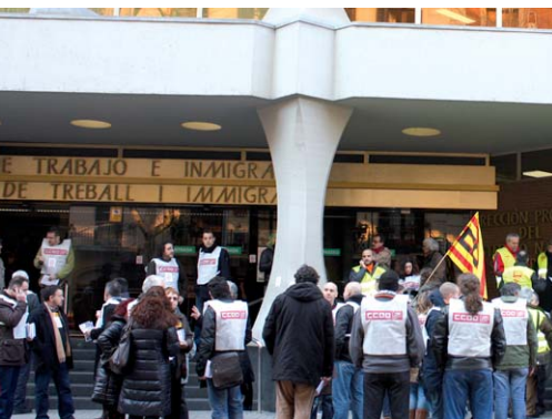
Ocupació de les oficines de la Seguretat Social a Barcelona

Govern i sindicats han arribat a un acord sobre la reforma de les pensions, que haurà de ser ratificat demà dimarts pel Consell Confederal de CCOO