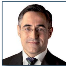
Ramon Tremosa (CiU)

En les últimes dècades s'ha assistit a dos fenòmens demogràfics rellevants: el descens de la taxa de natalitat i l'augment de l'esperança de vida. Per afrontar-los, molts estats membres han reforçat els seus sistemes de pensions i el nostre país no ha de ser una excepció. Per això fa falta introduir profundes reformes en el nostre mercat laboral i en el nostre sistema de pensions. Així mateix, aquestes mesures contribuiran a l'assoliment dels objectius de l'Estratègia 2020 en matèria d'ocupació i de sostenibilitat a llarg termini de les finances públiques.