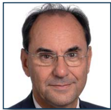
Aleix Vidal-Quadras (PP)

Amb la publicació el 7 de juliol de 2010 passat del Llibre verd sobre el sistema de pensions, la Comissió Europea no qüestiona que els responsables de la prestació siguin els estats membres, i tampoc pretén que hi hagi un sistema de pensions ideal amb un disseny vàlid per al conjunt de la Unió.