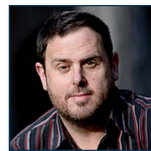
Oriol Junqueras (ERC)

A ICV-EUiA creiem que cal crear un sistema europeu de normes laborals i socials bàsiques que reguli també les pensions contributives. Cal elaborar una directiva marc de pensions que reguli la discriminació de les dones que no han cotitzat perquè s'han dedicat a "les feines de la casa", que garanteixi que cap pensió estigui per sota del SMI de cada estat o que unifiqui les cotitzacions efectuades per als treballadors o treballadores que hagin treballat a diferents estats de la UE.