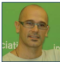
Raül Romeva (ICV-EUiA)

La demografia és l'argument escollit per diferents països de la Unió Europea per justificar l'ampliació de l'edat de jubilació. El tret de sortida el va donar Alemanya el març del 2007, però França, Itàlia o l'Estat espanyol no han trigat massa a aventurar-se per la mateixa senda, tot i trobar-hi una forta resistència ciutadana. La Comissió, amb la publicació el juliol passat del Llibre verd "per uns sistemes de pensions europeus adequats, sostenibles i segurs", ha donat format europeu al debat, incloent-hi la qüestió gens espúria del paper que hi han de tenir les pensions privades. Nosaltres hem volgut demanar als nostres europarlamentaris a Brussel·les que ens diguin si consideren necessària l'ampliació de l'edat de jubilació, i fins a quin punt és important des del seu punt de vista que la solució sigui comuna a escala de la Unió Europea.