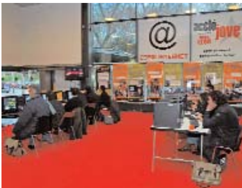
Tothom connectat al ciberespai d'Acció Jove