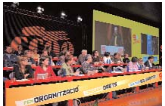
La nova Executiva atenta: epl que parla "el jefe"