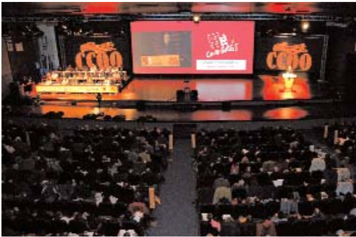
Al Congrés van participar 241 delegades i 454 delegats