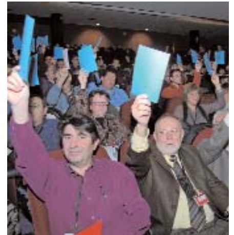
Votant a mà alçada. Compte amb el desodorant