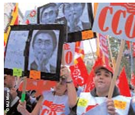
La pressió sindical està aconseguint salvar un bon nombre de llocs de treball

Però no només l'automoció s'està veient afectada. El grup Roca va presentar un ERO temporal que afectarà 1.990 treballadors de les tres fàbriques espanyoles de sanitaris, entre ells 1.030 de la factoria de Gavà. També el fabricant de casquets de bombetes Vitri va anunciar l'acomiadament dels 71 treballadors –i el consegüent tancament– de la fàbrica que té a Torelló. Aquest ERO incompleix els pactes acordats anteriorment per la Direcció i els sindicats, que recollien el compromís de l'empresa de mantenir les produccions de més valor afegit aquí i deslocalitzar la resta a Eslovàquia. Per la seva banda, Kraft ha plantejat 27 acomiadaments a Montornès del Vallès, 17 a la Roca i 27 més a Granollers. Sense oblidar Sony, que va anunciar finalment l'ERO que