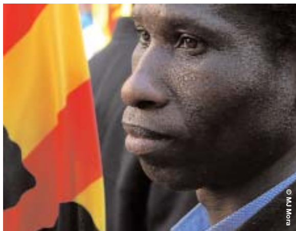
CCOO desconfia de la política de pactes nacionals del Govern català

Per la seva banda, la Secretaria d'Immigració i el Centre d'estudis i Recerca Sindicals (CERES) de CCOO