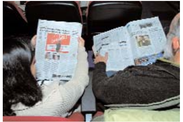
CCOO, protagonista als mitjans de comunicació