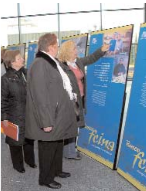
Les exposicions: "Mira, aquest el conec"