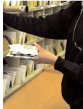
El Govern carrega sobre els funcionaris la crisi econòmica

Amb aquesta mesura es veuen afectades gairebé un milió de persones a tot Espanya, principalment funcionaris de l'Estat i transferits que