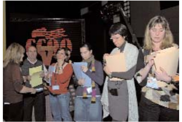
Servei d'organització: preparats, llestos...