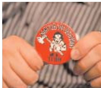
Canya contra els acomiadaments!