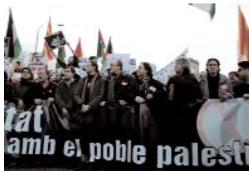
Un moment de la manifestació a Barcelona

Aquesta campanya arriba després de l'èxit de les manifestacions en què desenes de milers de ciutadans i ciutadanes es van mobilitzar contra la brutal agressió militar israeliana i per exigir a governs i institucions internacionals l'adopció de mesures per aconseguir l'alto el foc i la creació de vies per assolir una pau justa i duradora. CCOO se suma a aquestes peticions mentre demana també a Hamàs i a totes les organitzacions palestines que posin fi als atacs contra la població d'Israel.