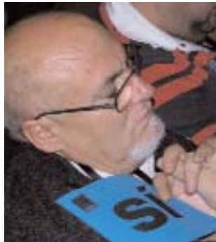
"És quan dormo que hi veig clar"