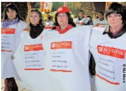
La crisi afecta especialment les dones

CCOO celebra aquest 8 de Març amb diferents actes per reivindicar millores socials i laborals. Així, el dilluns 9 de març al matí, CCOO del Barcelonès organitza una taula rodona per debatre com afecta l'actual crisi econòmica a les dones treballadores; serà a les 10 h a la sala d'actes de Via Laietana, 16, Barcelona. A continuació, a les 13 h, la Secretaria de la Dona de CCOO de Catalunya ha convocat una manifestació fins a la seu de la patronal Foment del Treball per fer visible, un cop més, la lluita per la igualtat, també en el món laboral.