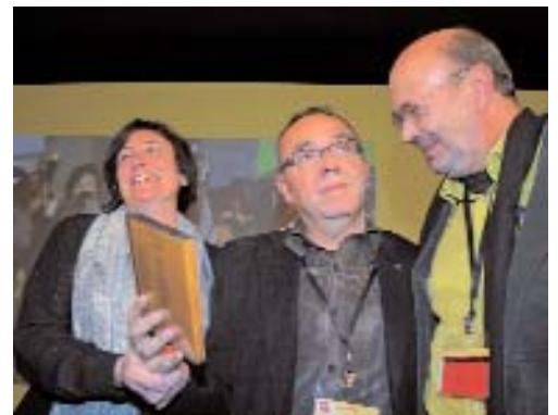
El merescut homenatge al Coscu en el seu comiat