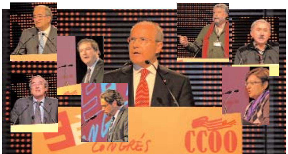
Ventall de convidats