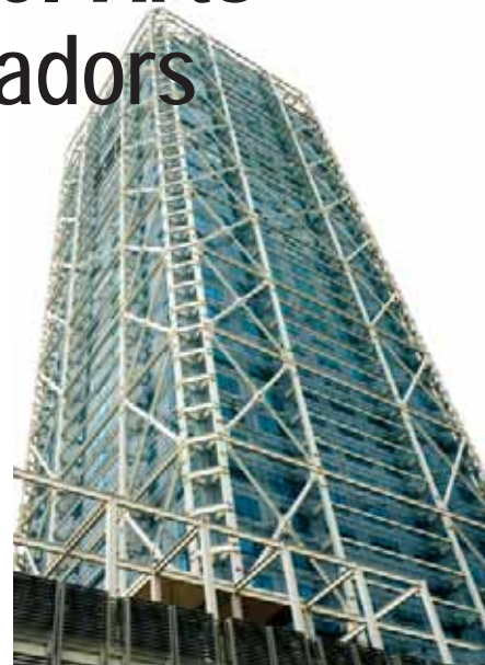
CCOO espera que aquesta sentència serveixi de precedent

molt positiva la sentència i espera que serveixi de precedent i repercuteixi en la millora de la situació laboral dels treballadors i treballadores dels sectors de l'hostaleria i de la neteja de Catalunya.