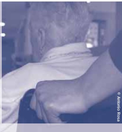
S'estableix l'excedència de fins a dos anys per la cura de familiars de 2n grau

Pel que fa al primer, la Llei parla de la possibilitat d'adaptar, a través de la negociació col·lectiva, la distribució de la jornada de treball per fer compatible la vida familiar i la laboral. En el segon també es dona l'opció d'acumular l'hora de lactància per jornades completes en casos de part múltiple i sempre que això s'inclouï en el conveni.