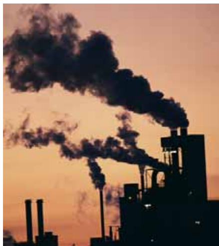
Les empreses brutes i malbaratadores de recursos acabaran tancant

A hores d'ara gairebé tothom està d'acord que l'escalfament global és una realitat, que té l'origen en l'activitat humana i que pot tenir greus conseqüències econòmiques i socials per a tota la humanitat.