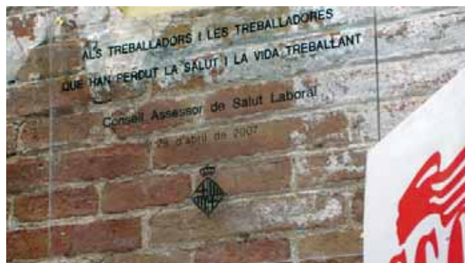
Una placa recorda els treballadors que han perdut la vida a la feina

El divendres 27 d'abril, doncs, es va fer un acte amb la UGT a Can Saladrigas, al barri del Poblenou de Barcelona: una assemblea conjunta on es va exigir un pacte nacional contra la precarietat i la sinistralitat en el sector de la construcció. Cal recordar que va ser en aquest districte on van perdre la vida alguns treballadors de les obres del 22@. En acabar l'acte, els secretaris generals de CCOO i UGT van descobrir una placa en reconeixement dels treballadors que perden la salut i la vida a la feina. També des de CCOO s'ha dut a terme una assemblea de delegats i delegades de prevenció, com a espai de reflexió, d'inter-