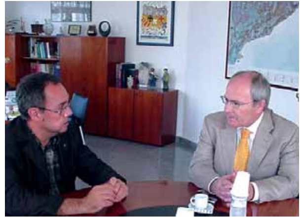
Els pactes nacionals no poden ser àmbits per validar les polítiques del Govern

són les regles del joc que es donen en aquests pactes, qui són els interlocutors i quins són els nivells d'acords que es poden assolir. Els pactes nacionals no poden ser àmbits per validar les polítiques del Govern, sinó que han de ser àmbits de trobada d'organitzacions representatives d'interessos, amb capacitat d'assumir responsablement els acords a què s'arribi, i han de donar com a resultat compromisos concrets àmpliament consensuats, que s'hagin de materialitzar en actuacions i recursos que incideixin a canviar l'estat inicial del problema que es vol resoldre.