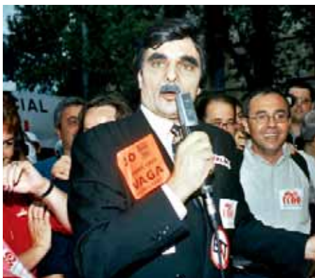
Vaga general del 20J contra el "decretazo"

La sentència del Constitucional limita la capacitat dels governs per aprovar decrets llei sense justificació, amb l'objectiu d'evitar el diàleg social i el debat parlamentari d'una llei. D'aquesta manera, els governs s'ho hauran de pensar dues vegades abans de tornar a fer servir aquest procediment.