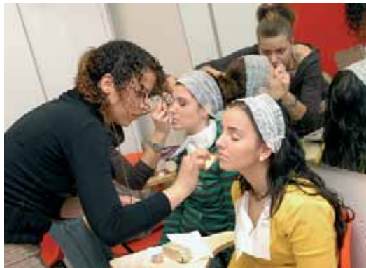
Hi ha molta oferta de cursos del sector serveis.

majoritaris en els cursos de major nivell professional o de més complexitat, i les dones, en canvi, són majoria en les especialitats d'una qualificació professional inferior. D'això es desprèn una dada que no per òbvia deixa de ser preocupant: a causa d'aquesta segregació formativa, les dones continuaran desenvolupant ocupacions de menys valor afegit i, per tant, continuaran tenint nivells més alts de precarietat laboral.