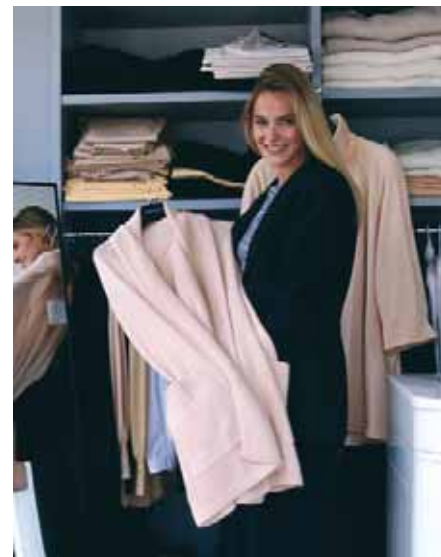
La conciliación de la vida personal y la laboral en el comercio es inexistente

¿Quién está dispuesto a trabajar todos los sábados y 8 festivos? Ya no hablemos de los municipios turísticos, donde la libertad de horarios comerciales es total. En el sector es habitual que las jornadas sean partidas, o sea hay que estar todo el día de cara al público con la