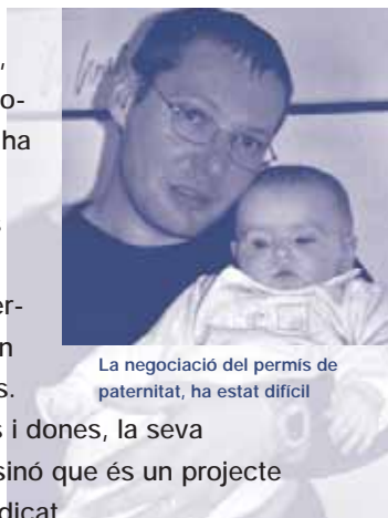
La negociació del permís de paternitat, ha estat difícil

Com que la igualtat és un bé que beneficia homes i dones, la seva defensa no és un objectiu exclusivament femení, sinó que és un projecte col·lectiu de totes les persones que formem el sindicat.