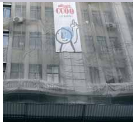
El Govern central no vol assumir la rehabilitació de la façana

La negativa dels governs centrals a fer aflorar la totalitat del patrimoni sindical acumulat, i a retornar la legitimitat de la propietat als sindicats en funció de la seva representativitat, contrasta amb les facilitats que els mateixos governs han mostrat envers la UGT en el retorn del patrimoni històric: l'any passat se li va concedir una subvenció de 150 milions d'euros, que se sumava a la de 4.144 milions de pessetes concedida l'any 1986 per aquest concepte. És en aquest context que hem de situar l'exigència que CCOO de Catalunya estem realitzant per dignificar la seu nacional del que és el primer sindicat català. CCOO de Catalunya fa anys que inverteix per dotar de més funcionalitat