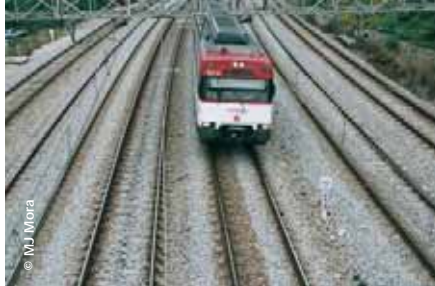
S'ha de prioritzar les inversions en manteniment d'infraestructures

L'any 2006, molts usuaris del transport públic han patit problemes per desplaçar-se a causa de diverses incidències. Això s'ha accentuat en la xarxa ferroviària de Rodalies de RENFE a Barcelona, amb avaries i retards recurrents, i s'ha creat la percepció, entre els ciutadans i ciutadanes, que és un servei deficient. Aquesta situació ja era coneguda per les administracions: el darrer decenni, RENFE va incrementar el passatge en un 80%, mentre que la inversió realitzada per l'Estat en aquest període era de tan sols el 5%. Sorpren, doncs, que davant les aglomeracions, els retards dels trens, la manca d'altres serveis, la supressió d'interventors o l'eliminació de punts d'expedició de títols de transport, el Ministeri de Foment invertís molts diners en la construcció de l'AVE, i descuidés el