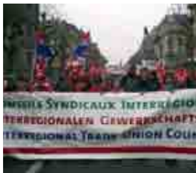
La pressió dels sindicats ha fet possible la modificació de la directiva Bolkestein

És per aquests motius que la CES va organitzar diverses manifestacions en l'àmbit europeu per dir "no a la directiva Bolkestein". La primera es va fer a Brussel·les el 19 de març de 2005 i va reunir més de 75.000 persones, i la segona, a Estrasburg, el 14 de febrer de 2006. Amb aquesta pressió s'ha aconseguit una gran victòria per als ciutadans i treballadors europeus, ja que la mobilització de la CES ha provocat que finalment es modifiqui la directiva.