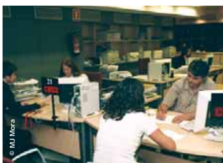
Cal dignificar la figura de l'empleat públic

A banda, CCOO de Catalunya també considera que són assignatures pendents del nou Govern aspectes com la creació d'una nova mesa general de les administracions públi-