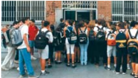
L'avançament de l'inici de curs ha generat dificultats.

Per contra, hem d'assenyalar l'avançament innecessari de 3 dies de la data d'inici del curs escolar, que ha dificultat