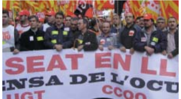
Els acords amb SEAT s'estan complint

CCOO de Catalunya valora de forma molt positiva que els treballadors i treballadores acomiadats en l'últim expedient de regulació de Seat de les plantes de Martorell i la Zona Franca, puguin reincorporar-se a l'empresa.