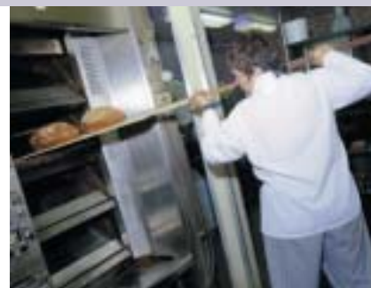
La taxa d'atur presenta uns nivells històricament baixos

Si ens fixem, però, en la qualitat dels llocs de treball que es creen, l'anàlisi ja no pot ser positiva, ja que sembla que no s'aprofita el creixement econòmic per crear ocupació de qualitat, més aviat al contrari. La taxa de temporalitat que suporten els treballadors i treballadores catalans es mou al voltant del 25%, però, en sectors que ocupen molta població a Catalunya,