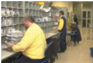
Amb l'acord augmenta el salari dels treballadors de Correus.

A dos anys de la liberalització del mercat, CCOO fa una valoració positiva d'aquestes millores, que contribueixen a la modernització de la companyia postal pública.