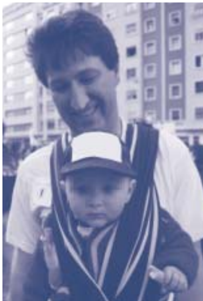
Es facilita la vida al personal de l'Administració pública catalana.

Des de fa anys, el sindicat planteja en negociacions la importància de preveure tant mesures sobre l'organització de treball com mesures específiques que facin possible conciliar tots els àmbits de la vida, i en aquest sentit la nostra experiència ens diu que hi ha molt pocs convenis amb avenços. La majoria d'empreses es remeten a la legislació vigent i fins i tot moltes tenen dificultats per complir-la.