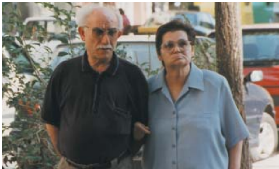
Continuen millorant les pensions més baixes.

Algunes propostes del Govern han estat frenades pel nostre sindicat, atès que suposaven retallades en els drets dels actuals o futurs pensionistes. Entre d'altres, destaca la voluntat d'endarrerir fins als 61 anys l'edat mínima de jubilació anticipada o la reforma integral de la