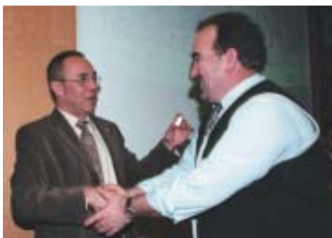
És important reconèixer la fidelitat de la nostra organització.

Així, el dia 25 de novembre, a la Fira de Cornellà de Llobregat, tindrà lloc un acte important pel seu significat, perquè en definitiva són els afiliats i afiliades els qui ens fan créixer com a primera força sindical de Catalunya.