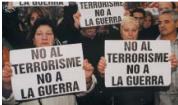
Diverses concentracions han mostrat el seu rebuig contra la guerra.

que ha exercit Israel contra la població civil del Líban i recorda a la comunitat internacional que l'orientació política del Govern palestí no l'eximeix de les seves responsabilitats i obligacions a l'hora de prestar assistència. La manca de reacció i el silenci de la Unió Europea davant els atacs de l'exèrcit israelià són moralment i políticament inacceptables.