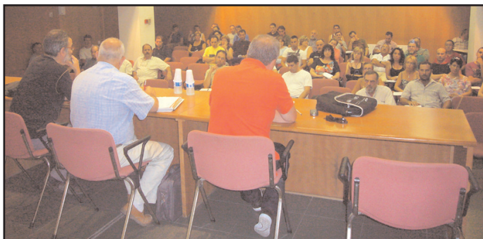
En la darrera assemblea, els delegats i delegades de CCOO van donar suport a les estratègies sindicals que s'empenguin per desbloquejar la negociació

La Federació d'Indústria de CCOO de Catalunya i la MCA-UGT estan preparant una assemblea conjunta de delegats i delegades del sec-