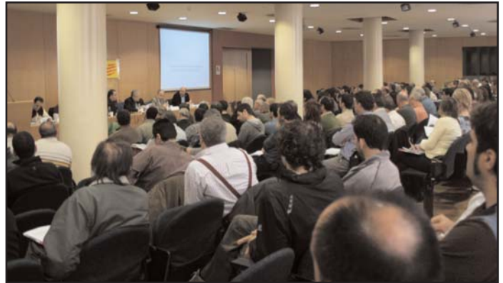
Tots els ponents van coincidir a destacar la importància i la utilitat de la guia com a eina de treball

La jornada també va servir per presentar la II guia sindical Problemes i solucions sobre contingències comunes i contingències professionals , que edita la Federació d'Indústria de CCOO de Catalunya i que vol ser una eina per als delegats i delegades per desenvolupar l'acció sindical a les empreses en defensa dels drets dels treballadors, i per detectar i evitar males pràctiques i vulneracions per part de les mútues i els empresaris en aquests casos.