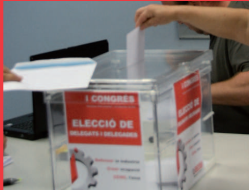
Més informació del congrés a www.industria.ccoo.cat

Fins a aquesta data es continuaran fent assemblees en les empreses, els centres de treball i les agrupacions de restes dels nostres sectors que encara han d'elegir els delegats i delegades que els corresponen.