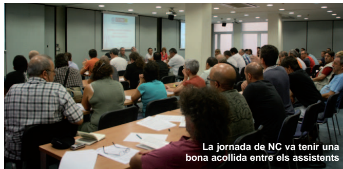
La jornada de NC va tenir una bona acollida entre els assistents

La negociació dels convenis va ser el tema estrella. Es van analitzar els canvis que s'han produït en els tràmits que s'han de seguir un cop s'ha denunciat el conveni col·lectiu, així com els terminis establerts per a la negociació