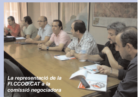
La representació de la FI.CCOO.CAT a la comissió negociadora

treballadors i treballadores del sector de l'inici de les negociacions i començar a preparar les propostes de la plataforma reivindicativa, la FI.CCOO.CAT està preparant assemblees informatives a les quatre empreses més emblemàtiques del metall de la província i també convocarà el conjunt de delegats i delegades del sector per recollir les seves aportacions i propostes.