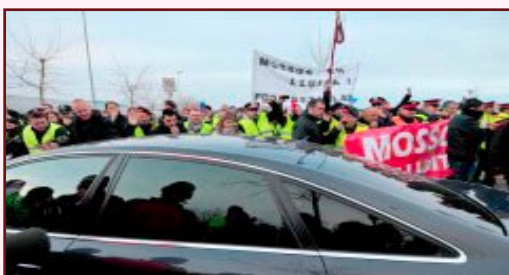
XIULADA A FELIP PUIG

Les organitzacions sindicals amb representació al cos de Mossos d'Esquadra han convocat per el proper dia 9 una important manifestació del col·lectiu per rebutjar les mesures d'ajust i retallades socials, laborals i salarials que preten aprovar el govern de CiU