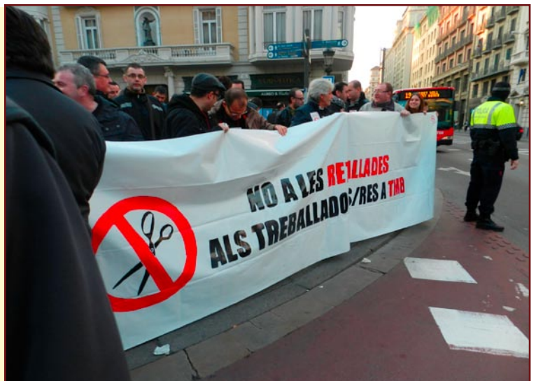
companys de TMB en manifestació

El passat 26 de gener, més de 3000 treballadors de METRO i AUTOBUSOS de Barcelona es van manifestar fins a la Plaça Sant Jaume en rebuig de les propostes de retallades i ajustos que poden afectar tant a l'ocupació com a les condicions laborals i salarials de les plantilles i també en rebuig als increments de tarifes als usuaris i usuàries del transport públic