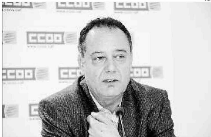
Imatge d'arxiu del dirigent de CCOO, Simón Rosado.

Per la seva experiència laboral en el sector del metall, Simón Rosado era una gran coneixedor del teixit empresarial i industrial de Catalunya, cosa que el feia seguir de molt a prop tots els conflictes col·lectius i expedients de regula-