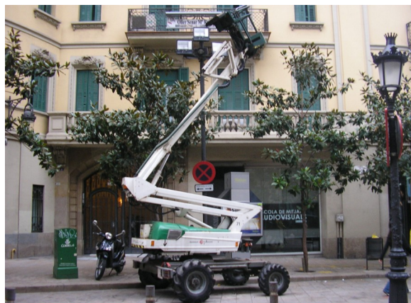
Phodators, un mal sueño que no debería repetirse

No tenemos explicación satisfactoria de dichos incidentes por parte de la empresa; en el Comité de Seguridad y Salud, no supieron, o no quisieron darla. En uno de los casos, la rotura del tubo y pérdida del hidráulico no se explican cómo pudo impedir que la plataforma bajara, dejando a su suerte al operario que la estaba utilizando, y que tuvo que ser rescatado por otra plataforma de Parcs. En el otro caso los mecanismos de seguridad puenteados, lo atribuyen a la empresa anterior a la que estuvo alquilada la plataforma y a la falta de revisión por parte de la empresa que la alquiló luego a Parques. Esperamos el informe de los resultados de la investigación de los incidentes, aunque no apreciamos mucho interés por parte de los responsables de Relaciones Laborales.