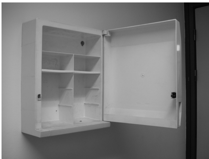
Una de les farmaciòles a Torrent de l'Olla (buida de contingut)

On són les farmaciòles de Torrent de l'Olla?.