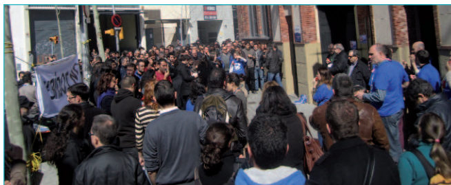
La primera acció de protesta va ser una cassolada a les portes del centre

El Comitè d'Empresa s'ha reunit amb una representació de diferents grups parlamentaris que integren la Mesa d'Empresa i Ocupació, aprofitant la seva visita a les instal·lacions d'Alstom Wind Barcelona, per exposar-los la situació del centre de treball i com els afecta el pla de reestructuració. També els ha demanat suport institucional per intercedir davant l'empresa i per promoure mesures que garanteixin la viabilitat del sector eòlic al nostre país.